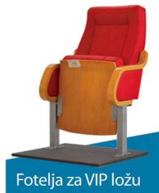
Fotelja za VIP ložu