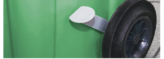
Podizač poklopca - otvaranje poklopca bez kontakta