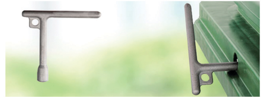
Brava za zaključavanje: Manuelna brava / Gravitaciona brava *Ostale opcije na upit