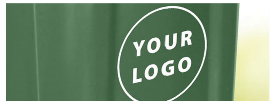
Obeležavanje: nalepnice / termo transfer / toplo utiskivanje / graviranje alata