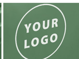
Obeležavanje: nalepnice / termo transfer / toplo utiskivanje / graviranje alata