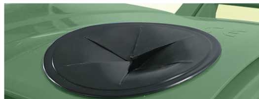
Otvor za separaciju otpada