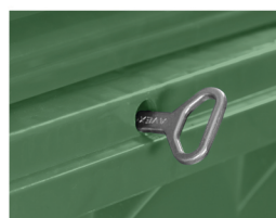
Brava za zaključavanje: Manuelna brava / Gravitaciona brava *Ostale opcije na upit