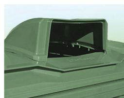
Hauba Mogućnost postavke poklopca sa haubom