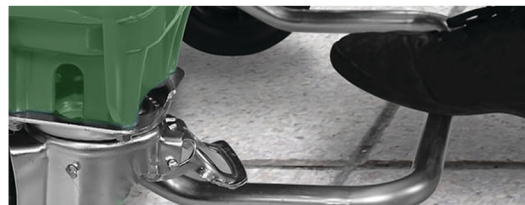
Podizač poklopca - otvaranje poklopca bez kontakta